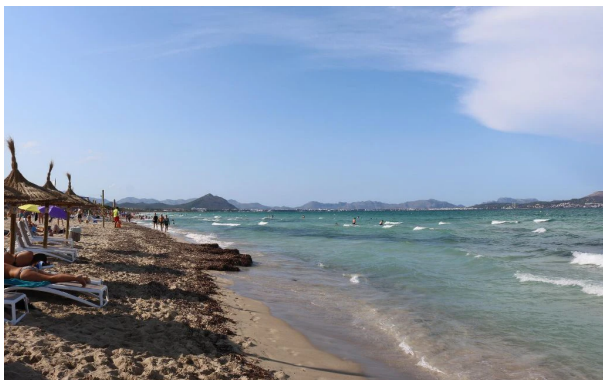
Playa del Muro